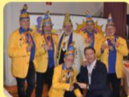
Fasching Aktiv Sitzung 2019 in Gerasdorf

Ein Faschingsnarr darf alles hinterfragen. Als solcher bleibt er lebenslang ein Kind. Er soll pointiert dann stets die Wahrheit sagen und manchen zeigen, was sie wirklich sind. Im Namen vieler, die sich nicht mehr trauen stand er als Faschingsnarr im Lichterschein. Das war die schönste Zeit und immer, wenn ER da war, dann war er stolz ein Faschingsnarr zu sein. Das war die schönste Zeit Und immer, wenn sie da war, dann war er stolz ein Faschingsnarr zu sein.