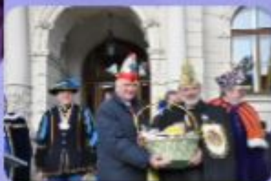
Landesnarrenwecken Laa 2011

LH Erwin Pröll hatte sein 20-jähriges Landeshauptmann-Jubiläum,