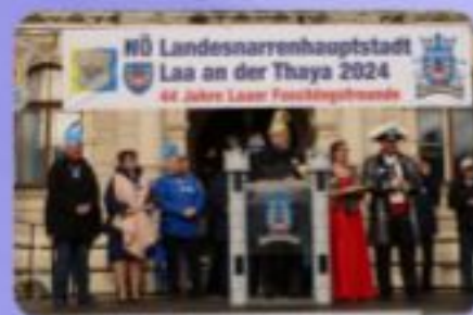
Landesnarrenwecken Laa 2023

... und auch unser 44-jähriges Gedenkubiläum