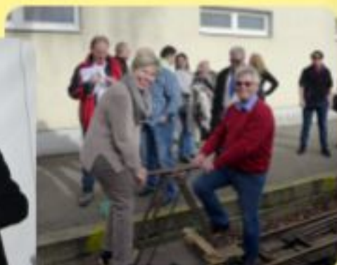
Rahmenprogramm der NÖ Landessitzung 2016 im Wiener Prater

Ein Faschingsnarr, der niemals war allein, verlässt uns heut' in Richtung Pension. Abend feiern mit ihm seine Freunde Happy End, das wissen alle schon samt. Es endet heute eine große Ära, die zeigte, wie schön Fasching einmal war. Das war die schönste Zeit. Und immer, wenn ER da war, dann fühl' ich Frieden und Geborgenheit. Das war die schönste Zeit. Und immer, wenn sie da war, dann fühl' ich Frieden und Geborgenheit.