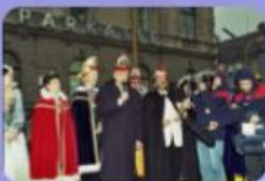
Landesnarrenwecken in Laa 1994

Da waren die Haare und der Bart noch dunkel