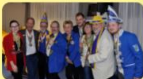
Fasching Aktiv Sitzung 2020 in Gerasdorf