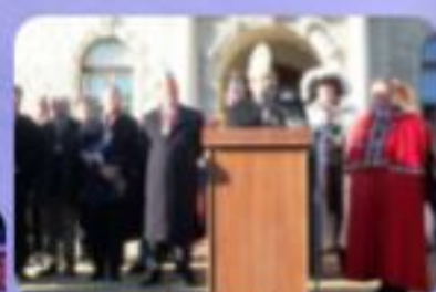
Das war vor 20 Jahren – Landesnarrenwecken