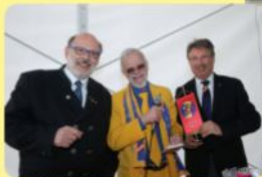
NÖ Landessitzung 2016 im Wiener Prater