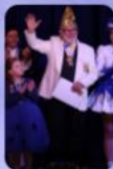
„LAArsch gut“ 2024

Da waren die Haare und der Bart noch dunkel