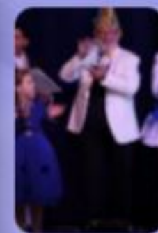
„LAArsch gut“ 2024

Daher überraschte er dir in Laa diesen Geschenkkorb.