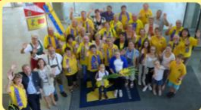
Gildenausflug 2016 nach St. Pölten