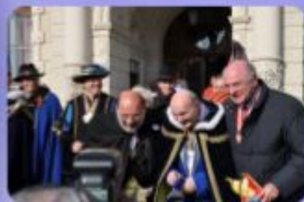
Landesnarrenwecken Laa 2011

Ein legendäres Bild von den drei Oberhaupt-Glözen. Das Landesprinzenpaar erwählte in seinem Prolog die „NÖ-Landesfrau“.