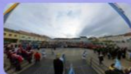
Landesnarrenwecken Laa 2023 – dein letztes Landesnarrenwecken als NÖ-Landespräsident.

(dieses Bild hat schon etwas von „Abschied“)