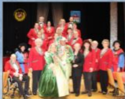
Die Faschingsgilde Traiskirchen sagt dir Danke für 31 Jahre als NÖ Landespräsident.

Tschau – Ciao – arrivederci – ci rivedremo ancora e ancora – grazie di tutto.