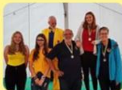
Gildenolympiade 2018 im Wiener Prater

Ein Faschingsnarr, der niemals war allein, verlässt uns heut' in Richtung Pension. Abend feiern mit ihm seine Freunde Happy End, das wissen alle schon samt. Es endet heute eine große Ära, die zeigte, wie schön Fasching einmal war. Das war die schönste Zeit. Und immer, wenn ER da war, dann fühl' ich Frieden und Geborgenheit. Das war die schönste Zeit. Und immer, wenn sie da war, dann fühl' ich Frieden und Geborgenheit.